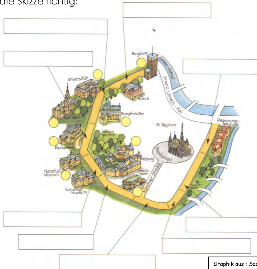
Graphik aus : Sachunterricht 3