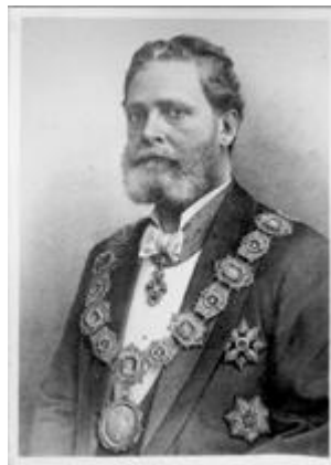
Bürgermeister von 1897–1910

Am Dr. Karl Lueger-Ring befinden sich das Rathaus, der Rathausplatz, die Universität und das Burgtheater .