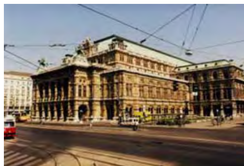
Die Wiener Oper

Wien entstand auf den Resten des römischen Kastells Vindobona . Im Mittelalter herrschten die Babenberger in der Stadt. Anschließend hatten von 1282 bis 1918 die Habsburger hier ihren Herrschersitz . Zweimal (1529 und 1683) konnte sich die Stadt gegen die Türken erfolgreich verteidigen. Nach dem endgültigen Sieg über die Türken, erfolgte die große Zeit des Barocks . Die Vorstädte wurden wieder aufgebaut und der Adel errichtete Paläste. Nach 1857 begann die Ringstraßenära , die auch heute noch das Stadtbild prägt.