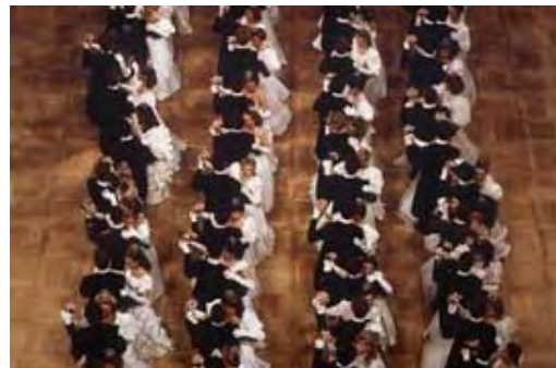
Tanzende Paare am Wiener Opernball.