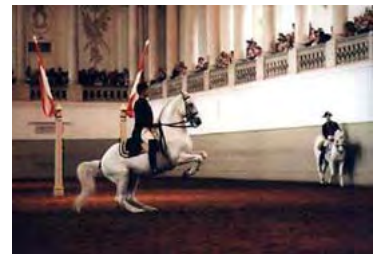
Lipizzaner der Spanischen Hofreitschule

Im Leopoldinischen Trakt der Hofburg befindet sich heute der Amtssitz des Bundespräsidenten . In anderen Teilen findet man die Nationalbibliothek , das Völkerkundemuseum und Teile des Kunsthistorischen Museums, die Schatzkammer , die Spanische Hofreitschule , die Hofburgkapelle , die Redoutensäle und ein Konferenzzentrum. Außerdem ist die heutige Hofburg Auftrittsort der Wiener Sängerknaben und der Lipizzaner, den berühmten weißen Pferde der Spanischen Hofreitschule.