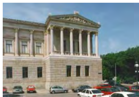
Einer der beiden Eckpavillons des Parlaments