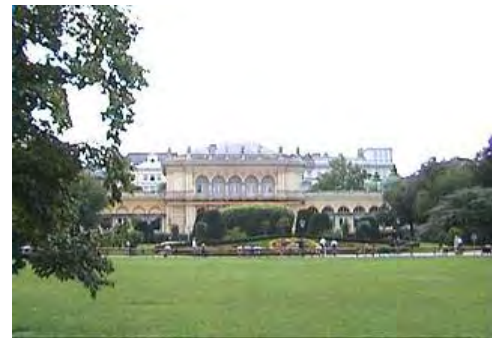
Hübner Kursalon Veranstaltungsort für Bälle und Konzerte