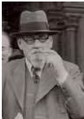
Dr. Karl Renner

Der Dr. Karl Renner-Ring erinnert an den ersten Bundespräsidenten der Zweiten Republik Österreich . Karl Renner (1870-1950) war sozialdemokratischer Politiker, 1918-1920 Staatskanzler , 1945 wieder Regierungschef und 1945-950 erster Bundespräsident der Zweiten Republik . In Büchern, die er schrieb, setzte er sich mit sozialpolitischen Themen auseinander.