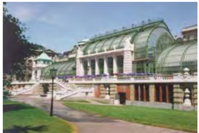
Palmenhaus im Burggarten

Als Denkmäler sind Wolfgang Amadeus Mozart, Kaiser Franz I. Stephan, Kaiser Franz Josef I. und Abraham Santa Clara anzutreffen.