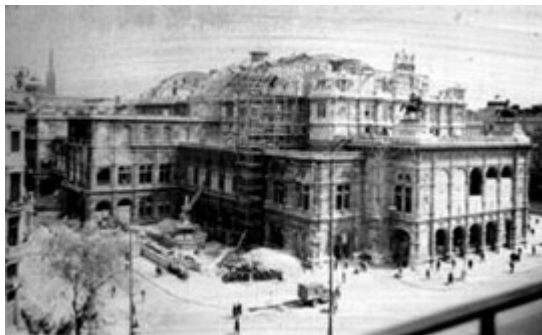
Bombenschäden aus dem Zweiten Weltkrieg

1945 wurde die Staatsoper durch einen Bombenangriff weitgehend zerstört. Wiedereröffnet wurde am 5.11.1955 mit Beethovens Oper "Fidelio". Die Wiener Staatsoper ist heute eines der berühmtesten Opernhäuser der Welt. Ein schon traditionelles Ereignis ist der alljährliche Opernball am letzten Donnerstag im Fasching.