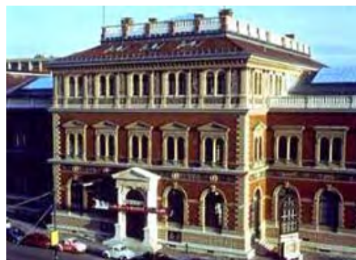
Museum und Akademie für angewandte Kunst

Das Museum und Akademie für angewandte Kunst wurde 1866-1871 nach einem Entwurf von Heinrich Ferstel in Stil der italienischen Renaissance erbaut. Renaissance ("Wiedergeburt" in französischer Sprache) ist ein Stil, der die griechisch-römische Antike wieder aufblühen lässt. Heute dient das Gebäude nicht nur als Museum, sondern auch als Ausbildungsort für junge Bildhauer und Maler.