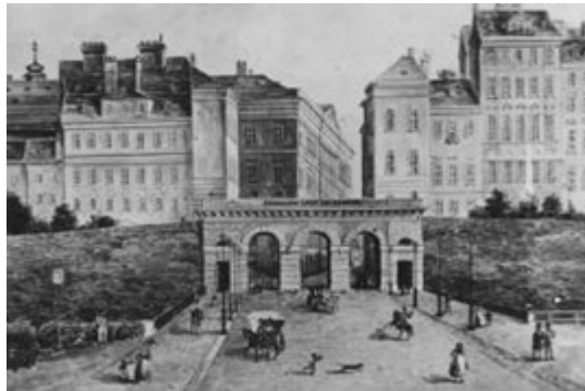
Das Schottentor um 1850

Der Schottenring erhielt seinen Namen von dem einst dort befindlichen Schottentor und der Schottenbastei . Am Schottenring befindet sich die Votivkirche, die Bundespolizeidirektion und die Wiener Börse .