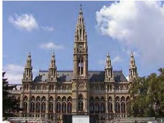
Das Wiener Rathaus

Das Rathaus wurde 1872-1883 vom Dombaumeister Friedrich Schmidt im neugotischen Stil erbaut. Der " Friedrich-Schmidt-Platz " hinter dem Gebäude erinnert noch heute an ihn. Es wurde zur 200-Jahr-Feier des Sieges über die Türken am 12. September 1883 eröffnet.