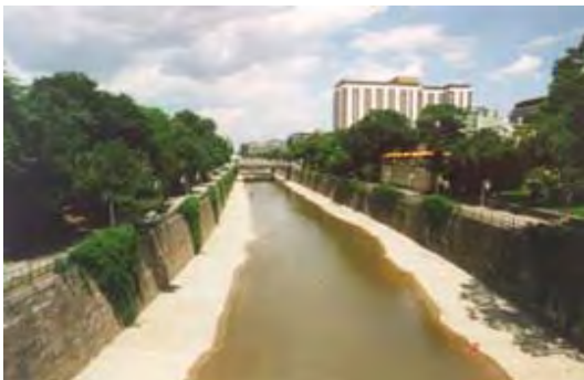
Der Wienfluss im Stadtpark

Der Parkring führt entlang des Stadtparks. Er wurde als erste Parkanlage von der Stadtverwaltung errichtet und 1862 eröffnet. Geplant wurde er vom Gartenarchitekt Rudolf Siebeck und vom Maler Josef Selleny . Dieser Park ist die größte Grünanlage der Inneren Stadt. Der Wienfluss teilt den Stadtpark in zwei Teile. Auf dem Areal befinden sich das Hauptgebäude und ein Glashaus des Stadtgartenamtes und der Kursalon Hübner .