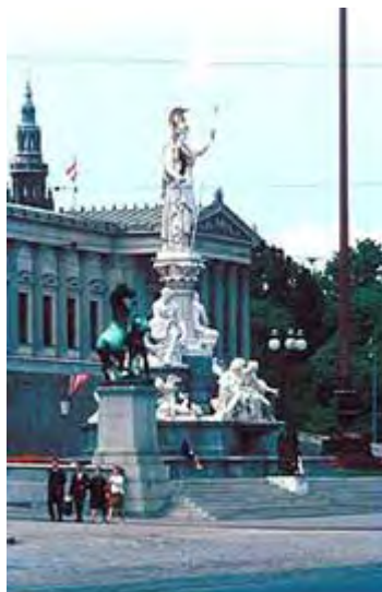
Pallas Athene - Göttin der Weisheit

An der Auffahrt erhebt sich der 4 m hohe, monumentale Pallas-Athene-Brunnen .