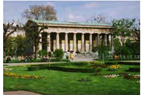
Der Theseustempel im Volksgarten

Im Garten befindet sich der Theseustempel , im dorischen (= griechischen) Stil erbaut. Der Theseustempel wurde von Peter Nobile errichtet. Theseus war ein griechischer Held und König von Athen. Weiters finden wird im Volksgarten die Denkmäler von Franz Grillparzer, Kaiserin Elisabeth und Julius Raab.