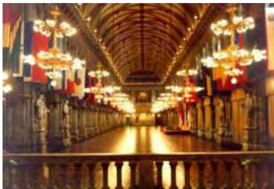
Der große Festsaal im Rathaus

Das Rathaus ist Amtssitz des Wiener Bürgermeisters und der städtischen Verwaltung . Der Bürgermeister von Wien ist gleichzeitig Landeshauptmann. Ihm stehen zwei Vizebürgermeister und mehrere Stadträte zur Seite.