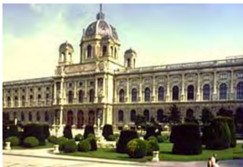
Das kunsthistorische Museum

Das Kunsthistorische Museum bietet wertvolle Kunstschätze , vor allem Gemälde . Auf seiner Kuppel steht die Bronzefigur der Pallas Athene als Schirmherrin für Kunst und Wissenschaft. Sie ist die griechische Göttin der Weisheit . Standbilder an der Dachbrüstung des Gebäudes zeigen 34 Künstler und Kunstförderer.