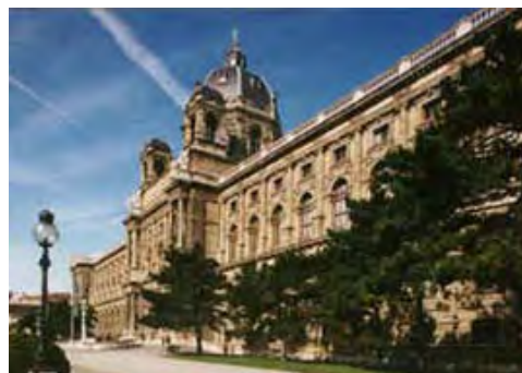
Das Naturhistorische Museum

Das Naturhistorische Museum bietet Sehenswertes aus dem Reich der Natur: Tiere, Pflanzen und Gesteine . Auf der Kuppel des Gebäudes steht die Bronzefigur des griechischen Sonnengottes Helios. Auf der Balustrade (= Geländer mit kleinen Säulen als Stützen) befinden sich 34 Statuen von berühmten Wissenschaftern. Das Museum bewahrt etwa 5,5 Millionen Insekten, eine halbe Million andere wirbellose Tiere und ebenso viele Wirbeltiere auf, dazu 3,5 Millionen Pflanzen .