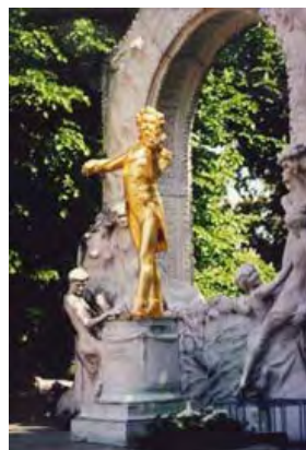
Johann Strauß Sohn